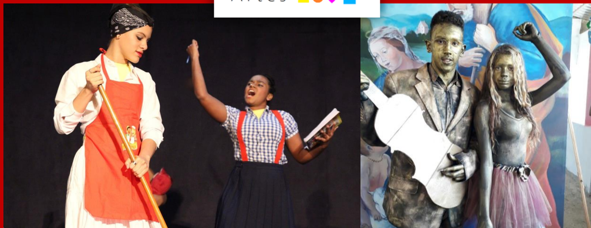
Ilustración 1 3ra y 4ta Gala Nacional de La Modalidad en Artes.

Versión Preliminar para Revisión y Retroalimentación