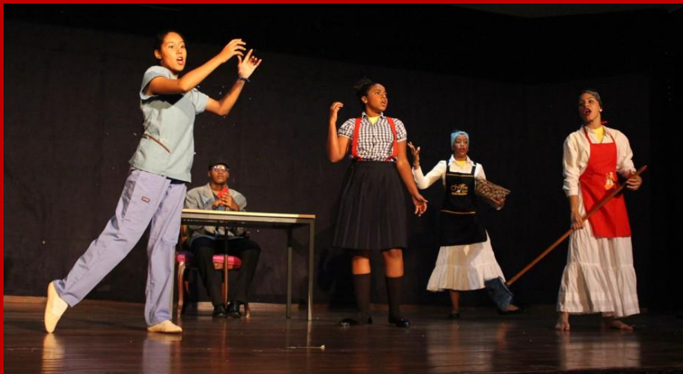
Ilustración 3 Gala de centro Educativo Mauricio Báez