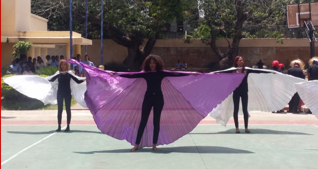
Ilustración 2 3RA Gala del Centro Educativo Salomé Ureña