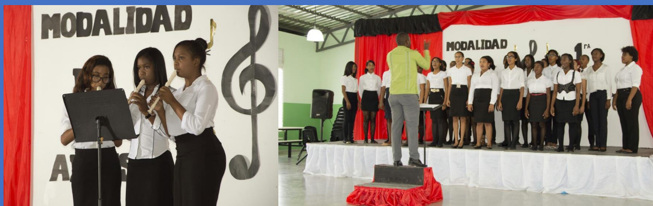
Ilustración 3 Centro Educativo Modalidad en Artes Inmaculada Concepción (Consuelo)