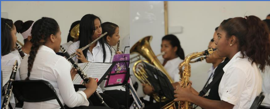
Ilustración 2, Banda de Música, centro Educativo Santa Ana